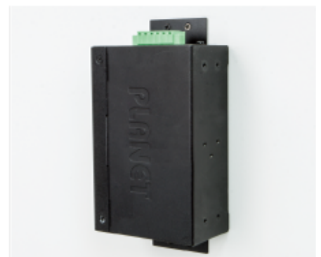
Side Wall Mounting (Space saving)