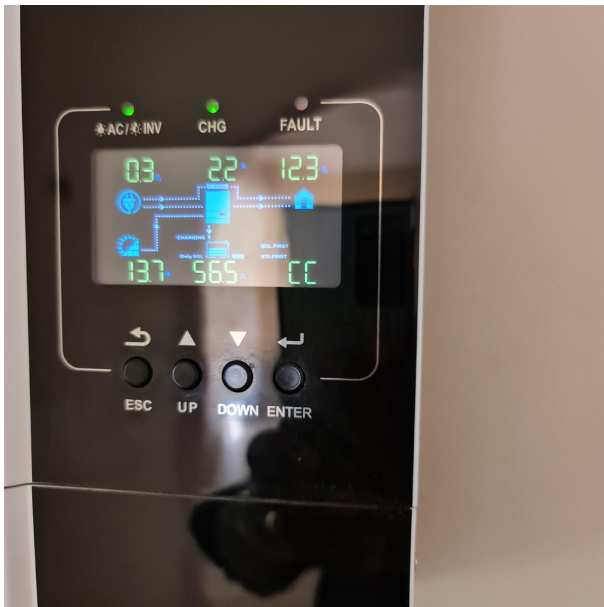
SPF 5000 ES verze (ilustrační foto)